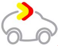
Tabelle complete per verifica aderenza a Normativa EURO.